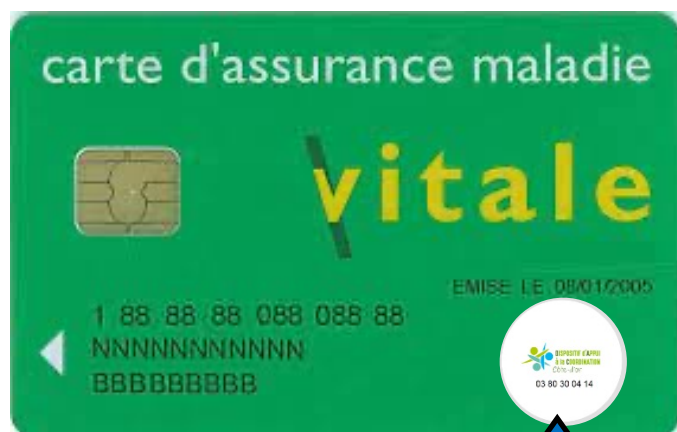
Pastille du DAC 21

Afin de faciliter la prise en charge du patient, de favoriser le maintien à domicile mais également de faciliter le lien ville / hôpital notamment pour les sorties d'hospitalisation, le Dispositif d'Appui à la Coordination met en place des gommettes avec son logo et le numéro unique. Ces dernières seront collées sur les cartes vitales des patients pris en charge par la coordination d'appui proposée par le DAC 21.