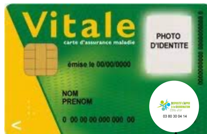
Pastille du DAC 21